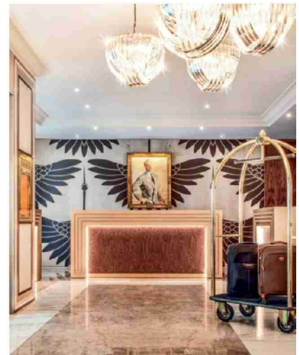
L'hôtel rejoint le label «Boutique & Design Hotel» de Suisse Tourisme. DR

A Genève, elle a cherché à créer une harmonie entre le moderne et le classique. Les 56 chambres rénovées, appelées «Unique!», se parent ainsi de couleurs riches, oscillant entre les teintes de bordeaux, d'orange, de prune et de turquoise. Un effort particulier a été fait en ce qui concerne le choix des étoffes et du mobilier, sans oublier les tableaux de la famille du Boisrouvray qui ornent notamment l'escalier central. Les chambres témoignent de l'engagement